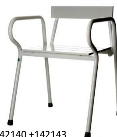
142140 + 142143